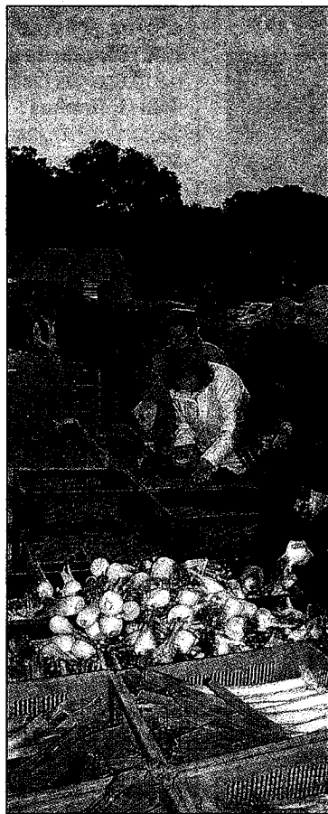
Les adhérents ont tous passé des contrats de quatre mois avec l'un au moins des trois producteurs de l'Amap des « Paniers de la Siagne ».