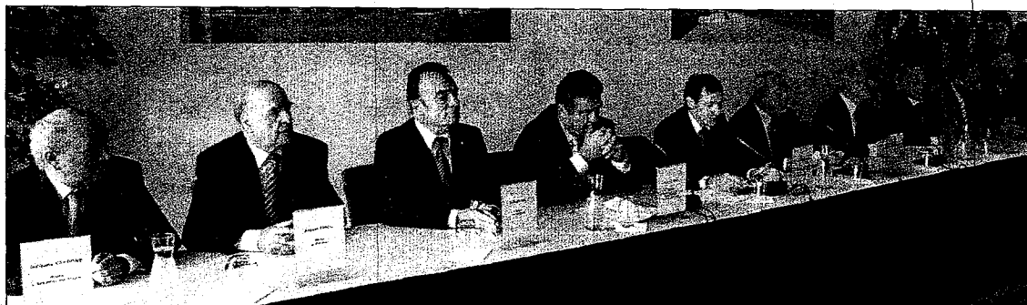
Les huit communes du bassin cannois enfin réunies autour du projet Aquaviva de la nouvelle station d'épuration, lors de la signature, hier, du contrat de concession.

SIGNATURE Ultramoderne, l'usine traitera les eaux usées des huit communes qui ont, enfin, paraphé hier le contrat avec la Lyonnaise des eaux