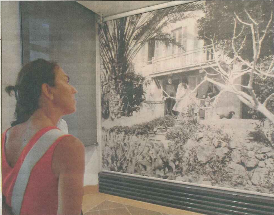
L'extérieur (ci-contre) et l'intérieur (ci-dessus) du musée Bonnard ont fait l'admiration de ses premiers visiteurs hier.

C'a y est. Le voile est tombé. Les discours du député-maire et du ministre de la Culture achevés (lire en page 6). Et les voilà qui se précipitent, ces férus d'art ou simples curieux, à la suite des « officiels », avec la ferme intention de franchir l'entrée à leur suite, et déflorer l'espace flambant neuf de l'établissement culturel.