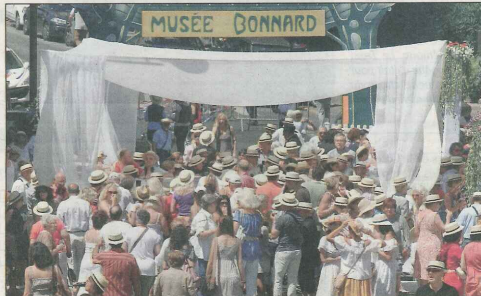
Des canotiers et une tente n'étaient pas de trop pour patienter avant d'entrer.

« Je peins et j'adore l'art. Ici, c'est fabuleux, très beau. L'expo est vraiment merveilleuse. Je pense et j'espère que la vie artistique du Cannet va se développer. Ça va donner de l'énergie au quartier. On a besoin que les musées naissent et fleurissent. Cela donne de la douceur à la vie. De la tendresse dans le monde... Et économiquement aussi. Le musée va drainer une nouvelle clientèle. »