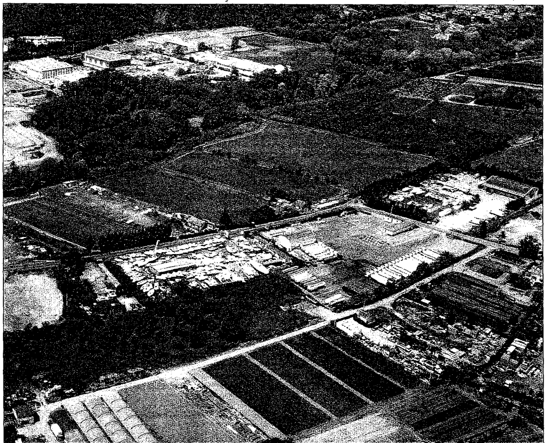
Les communes du Sivades ont refusé de lancer le projet d'un centre de compostage et d'un incinérateur sur les terrains initialement prévus à La Roquette-sur-Siagne.

Le prix ? Trois millions d'euros par an de surcoût, un non-sens que dénonce par ailleurs la Chambre de commerce : « cette situation représente près de vingt camions par jour, des émissions de CO 2 et une dépendance avec les Bouches-du-Rhône qui peuvent refuser les