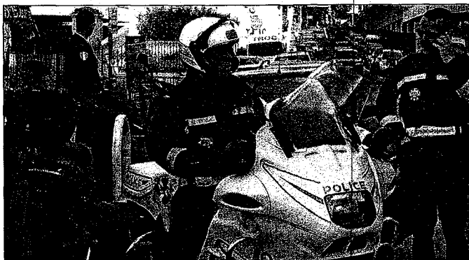
La vidéosurveillance semble avoir des effets positifs sur le bilan 2009 de la délinquance en zone urbaine, mais rien ne remplace l'action des hommes en uniforme sur le terrain.

Toujours est-il que par rapport à 2008, la délinquance générale a officiellement baissé de 7,3 % sur Cannes-Le Cannet. Une tendance constante depuis 2005. Signes ostentatoires de cette efficacité ? Sur la voie publique, la délinquance de proximité a chuté de 9,8 %. Sur la seule ville de Cannes, ces actes (vois, agressions...) les plus durement ressentis par la population, ont diminué de 12,5 % en 2009. Le taux d'élucidation passe de 23,6 % (2008) à 27,9 %. Tous les voyants semblent