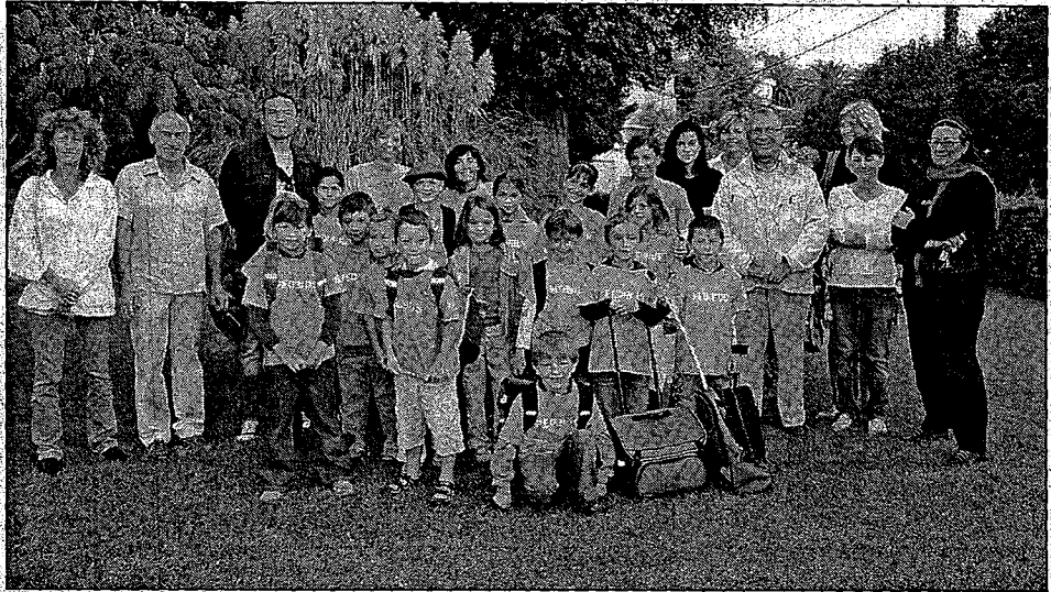
Dans l'Agenda 21 de Mandelieu, figure la mise en place d'un pédibus. Une expérience déjà tentée avec succès en septembre avec les écoliers de Minelle.

« Catalogues d'intentions » • L'Agenda 21 paraît cosmétique, mais c'est essentiel », assu-