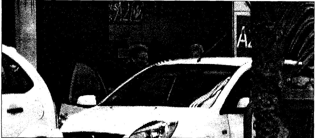
L'épouse du sénateur-maire de Saint-Jean-Cap-Ferrat a été interpellée à sa descente d'avion, elle venait de passer quelques jours avec son époux à Dubaï.