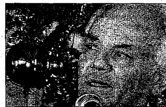
Le maire de Berre-les-Alpes est aujourd'hui au pied du mur de la justice.