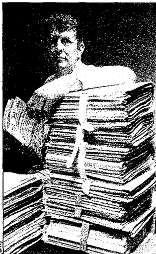
Figure de proue des magistrats de la juridiction interrégionale spécialisée de Marseille en charge des dossiers de grand banditisme et de délinquance financière, le juge Charles Duchaine est autant réputé pour sa technicité que pour son indépendance. Celle-ci s'est notamment traduite en 2002 par un livre « choc » consacré à son passage en principauté entre 1995 et 1999. Cet ouvrage intitulé « Juge à Monaco », avait fait l'effet d'une bombe. Dans ce brûlot, le juge Duchaine, alors en poste au pôle financier de Bastia, avait détaillé un système visant à étouffer les affaires sensibles.